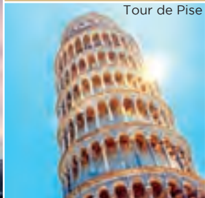
Tour de Pise